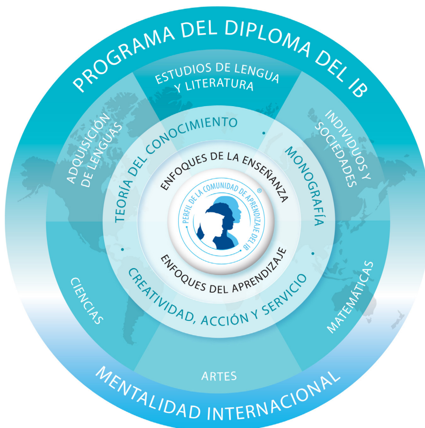
Figura 1 Modelo del Programa del Diploma

El programa se representa mediante seis áreas académicas dispuestas en torno a un núcleo (véase la figura 1); esta estructura fomenta el estudio simultáneo de una amplia variedad de áreas académicas. Los alumnos estudian dos lenguas modernas (o una lengua moderna y una clásica), una asignatura de humanidades o ciencias sociales, una ciencia, una asignatura de matemáticas y una de artes. Esta variedad hace del Programa del Diploma un programa exigente y muy eficaz como preparación para el ingreso a la universidad. Además, en cada una de las áreas académicas los alumnos tienen flexibilidad para elegir las asignaturas en las que estén particularmente interesados y que quizás deseen continuar estudiando en la universidad.